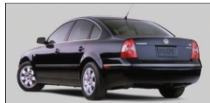
Depuis le début de l'année 2002, le repérage des véhicules équipés d'un dispositif Boomerang représente une valeur de plusieurs millions de dollars. Source: http://autos.yahoo.com

En effet, il est arrivé que le signal d'un véhicule volé mène les policiers vers un lieu où se trouvent plusieurs autres véhicules volés. Au cours des dernières années par exemple, le repérage d'un véhicule équipé d'un dispositif Boomerang, à Montréal, a permis aux autorités locales de découvrir un entrepôt de véhicules volés rempli de voitures luxueuses. De plus, une Mercedes équipée d'un