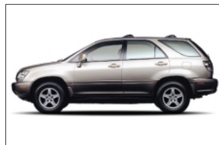
Le 9 mars dernier, Repérage Boomerang a retrouvé avec succès une Lexus RX 300 2001 en moins d'une heure.

Le vendredi 8 mars, vers 23 h, quatre hommes ont forcé le propriétaire d'une Lexus RX 300 à quitter son véhicule en le menaçant avec une arme. Le conducteur, craignant pour sa vie, leur a remis les clés du véhicule. Les voleurs ont pris la fuite avec la voiture, laissant le propriétaire dans le stationnement. La victime a immédiatement contacté les autorités locales en spécifiant que sa voiture était équipée d'un dispositif Boomerang.